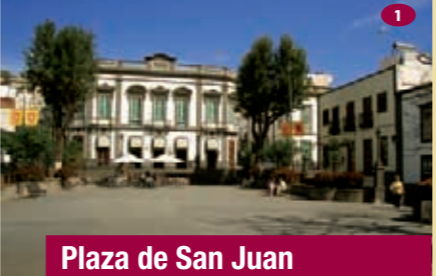
Plaza de San Juan

Es uno de los núcleos fundacionales de la Ciudad. De un simple vistazo alrededor de la plaza, podemos comprobar la evolución de la tipología de las viviendas del casco antiguo de Arucas, con edificaciones construidas en los siglos XVII, XVIII, XIX y XX. Este conjunto arquitectónico alcanza su máximo esplendor con la fachada principal de la Iglesia de San Juan Bautista.