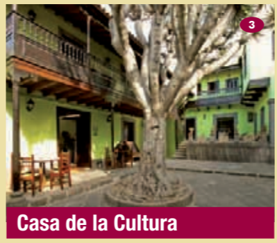
Casa de la Cultura

🕒 Todos los días de 9:00 a 12:30 horas y de 16:30 a 18:00 horas. ☎ 928 605 622