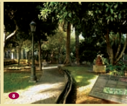
Jardín de la Marquesa

🕒 Lunes a viernes 9:00 a 14:00 horas; verano de 9:00 a 13:00 horas. ☎ 928 624 900