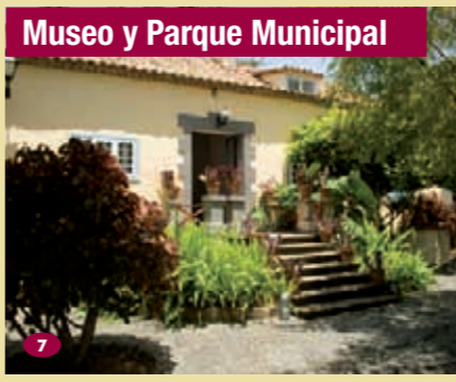
Museo y Parque Municipal

🕒 Lunes a viernes 9:00 a 14:00 horas; verano de 9:00 a 13:00 horas. ☎ 928 624 900